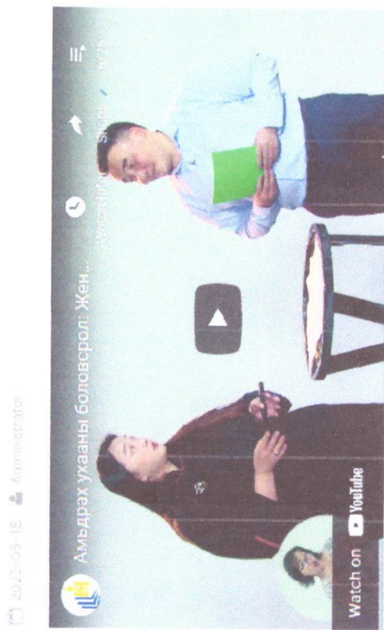
Жендэрийн хэвшмэл ойлголтыг ойлгох нь